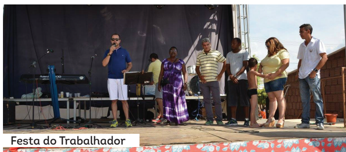
Festa do Trabalhador