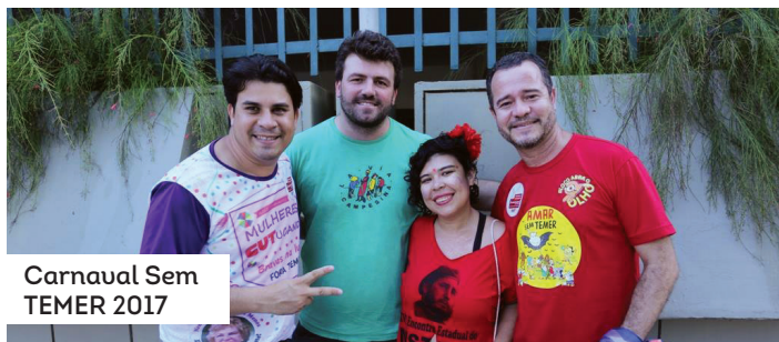
Carnaval Sem TEMER 2017