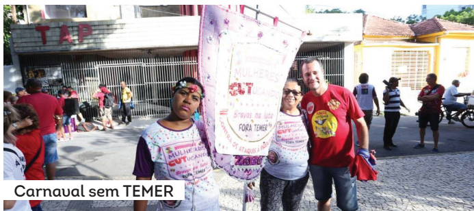
Carnaval sem TEMER