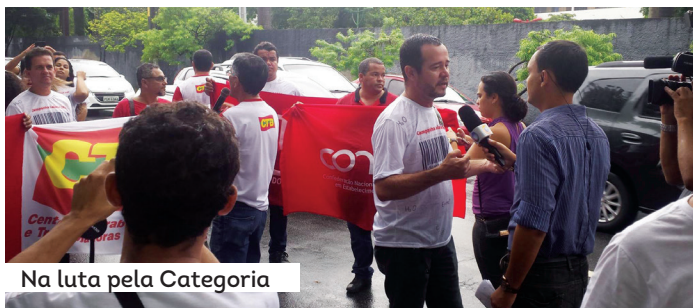
Na luta pela Categoria