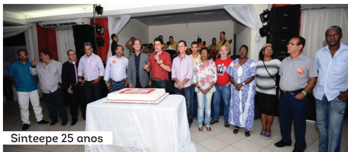
Sintepe 25 anos