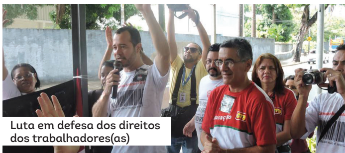
Luta em defesa dos direitos dos trabalhadores(as)