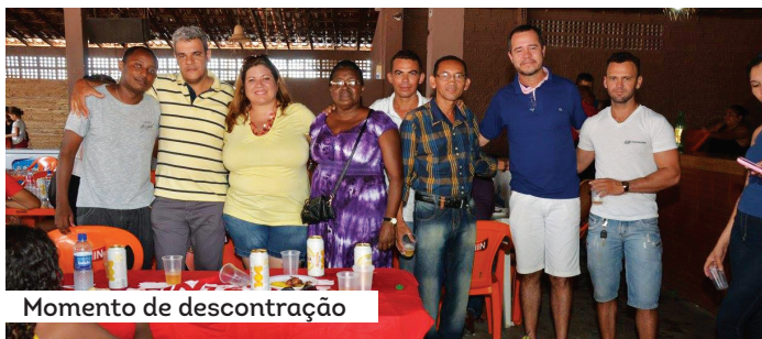
Momento de descontração